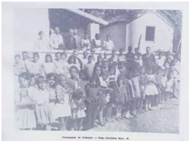
Foto das Famílias após o culto da Escola Bíblica Dominical.

A congregação contava com 136 membros na época. Registro Fotográfico da Época.